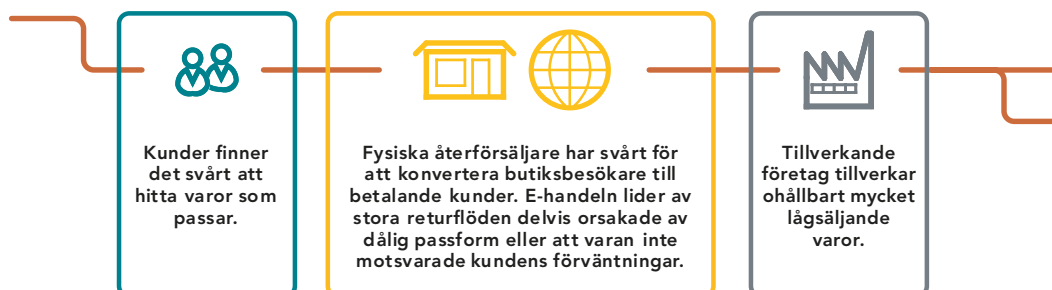
Figur 1. Problembild.

Resultatet är att matchning av digitala modeller förbättrar prestandan i detaljhandelns försörjningskedjor, särskilt genom förbättrad tillgänglighet gentemot konsument och förbättrad produktivitet ▶